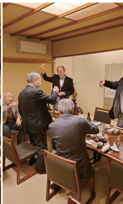
久々の夜例会に乾杯