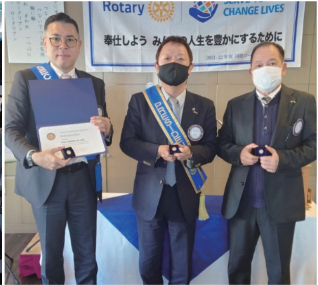
ロータリー財団 寄付バッジ贈呈