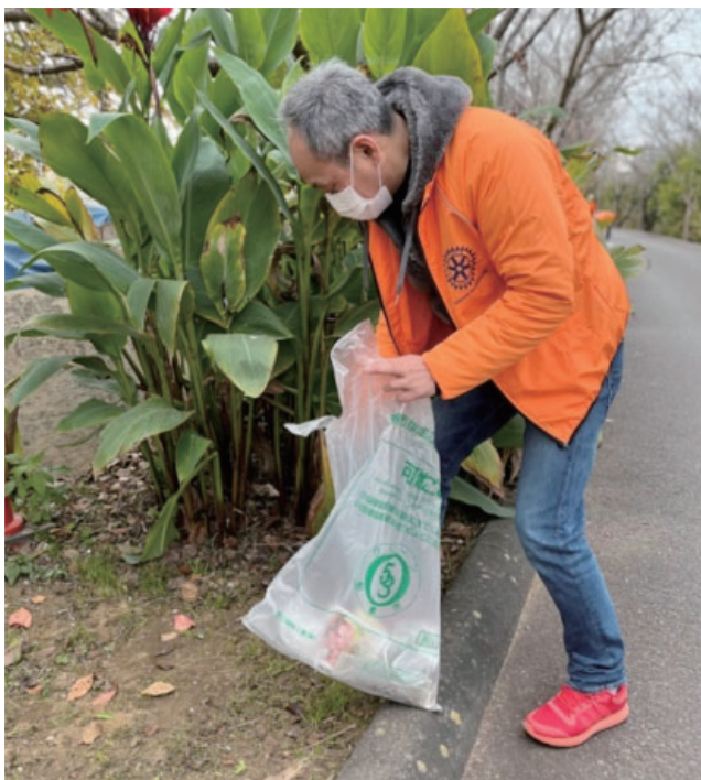
ゴミ拾いの奉仕活動する藤代会員