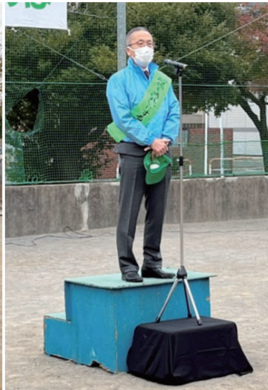
松戸 船橋市長ご挨拶